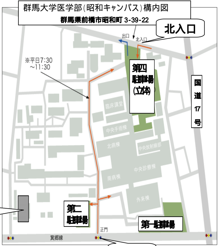
群馬大学医学部(昭和キャンパス)構内図 群馬県前橋市昭和町 3-39-22